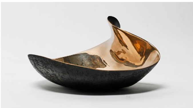
« Bronze 1 » Bronze poli et patiné 2016

La galerie Carole Decombe, qui présente régulièrement les pièces emblématiques du design scandinave du XXème siècle, est heureuse d'exposer cette fois-ci le travail d'une designer danoise contemporaine et de rassembler, pour la première fois à Paris, une sélection riche et hétéroclite de ses oeuvres personnelles, dont plusieurs inédites. Table de milieu et tables d'appoint, lustre, appliques et pièces de formes seront accompagnés de 2 oeuvres de la photographe LiliRoze.