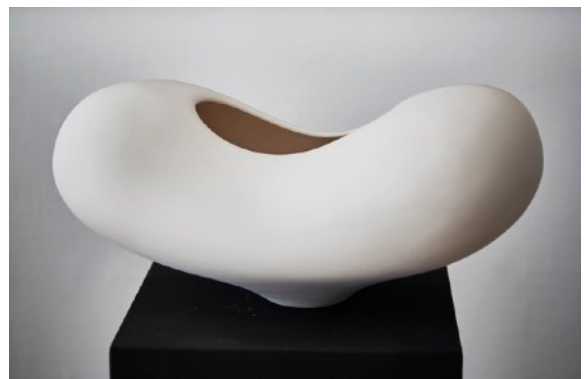
« White Soft » Faïence polie 2017