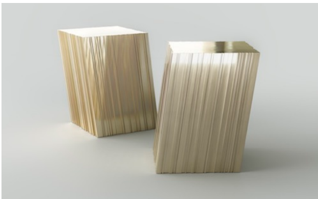
Tables « Code Bar » Laiton 2017